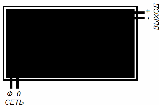
Рис.2. Внешний вид

ПО «БАСТИОН» 344018, г. Ростов-на-Дону, а/я 7532 Тел./факс: (863) 203-58-30 e-mail: ops@bast.ru Горячая линия: 8 (800) 200-58-30 (звонок по России бесплатный) www.bast.ru