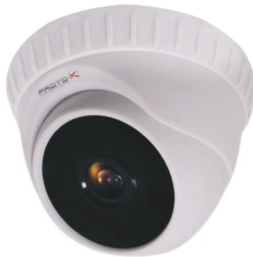
Купольная видеокамера с ИК подсветкой